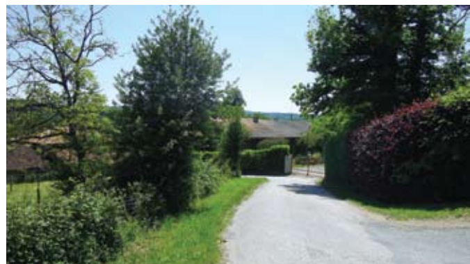
Village de la Mazière

2 Dans le bosquet, tourner à gauche et revenir au point de départ par le chemin emprunté à l'aller.