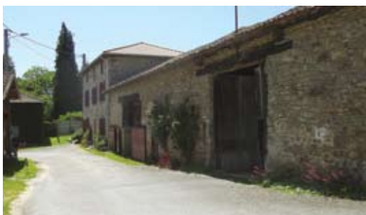
Vieilles granges à la Mazière